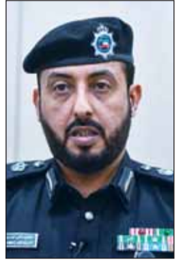
العميد د. أحمد الهاجري

بواقع 2 منصة لكل لجنة إقليمي عدد 1518 منصة تقريباً. وأفاد بأنه تم إصدار الهويات والاستمارات الخاصة بالمتطوعين من موظفي وزارة الداخلية المدنيين الراغبين بالعمل في اللجان الانتخابية والبالغ عددهم الإجمالي 4871 منهم 2232 من الذكور و2639 من الإناث، لافتاً إلى التنسيق مع جمعية الهلال الأحمر للاستعانة بفريق طبي تطوعي بمرکز الاقتراع أثناء سير عملية الانتخابات. وأكد الهاجري أن الإدارة خاطبت وزارة العدل لاتخاذ اللازم نمو مخاطبة اللجنة الاستشارية لإعداد ومتابعة إجراءات سير الانتخابات لإصدار التصاريح الخاصة لجمعيات النفع العام للمشاركة في عملية الانتخابات، مبيّناً أنه تم نشر القرار الوزاري بشأن تحديد وتقسيم لجان انتخاب أعضاء مجلس الأمة في الجريدة الرسمية (الكويت اليوم) وموافقة وزارة العدل بصورة من القرار حتى يتم تعيين رؤساء اللجان الانتخابية من القضاة.